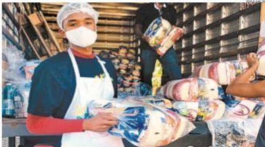
ONG SerCidadão está cadastrando e pretende ajudar 3 mil famílias de Paciência, Santa Cruz e Sepetiba

■ ONG SERCIDADÃO – Site: sercidadao.org.br/ , "Sercidadão" ou Banco Itaú, agência 8097, conta corrente 10.658-0, CNPJ 05.362.869/0001-61