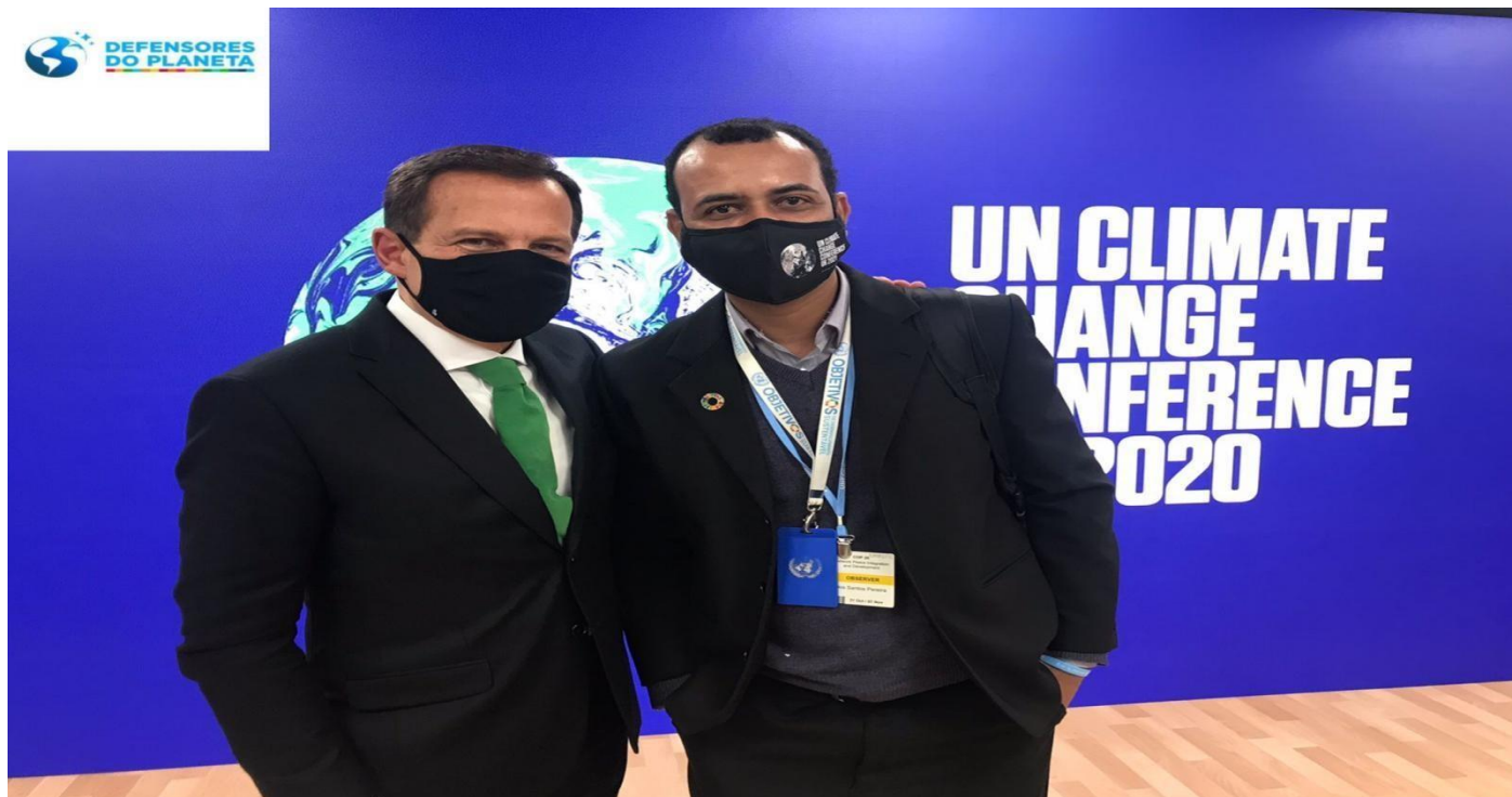
Governador de São Paulo.