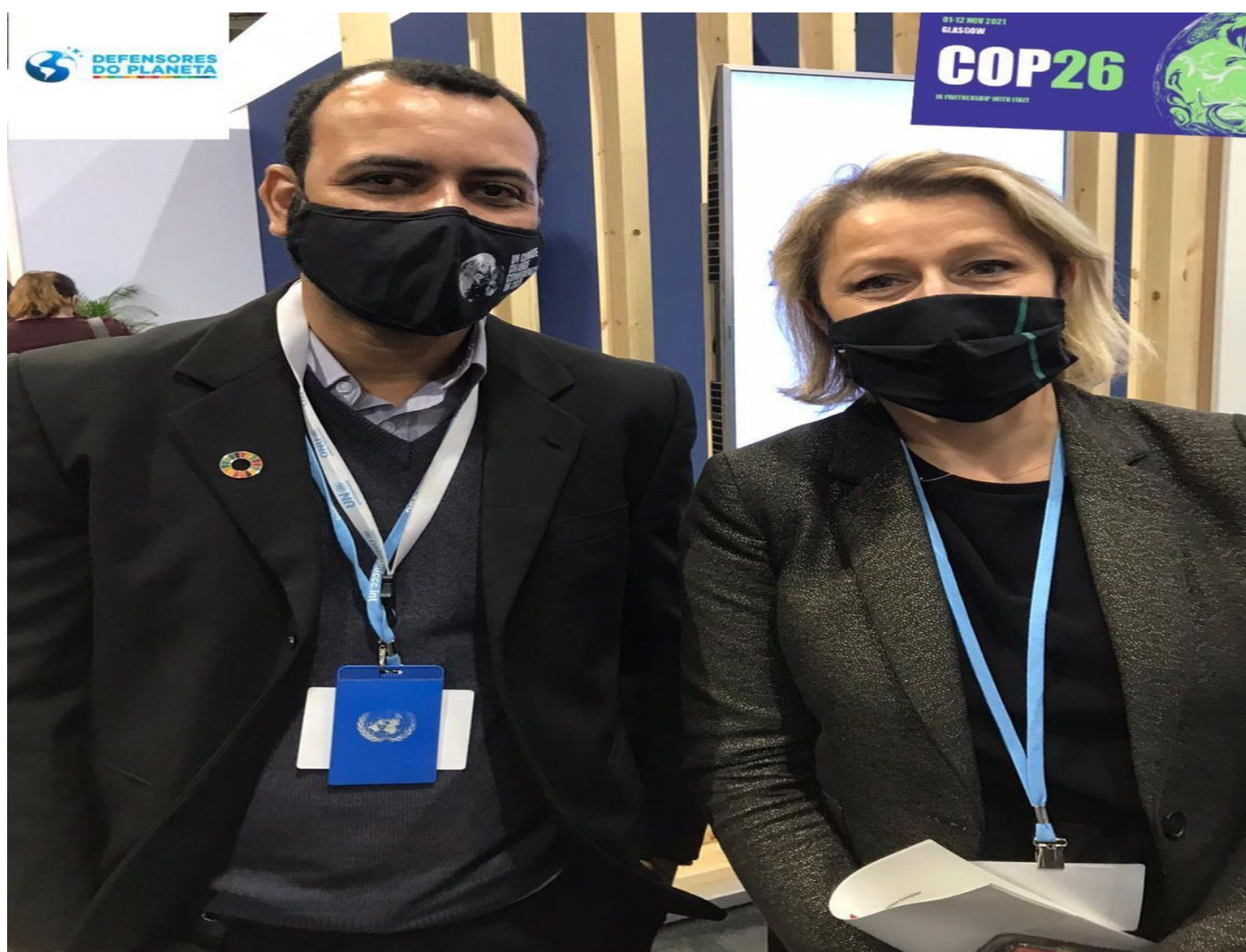
Ministra de meio ambiente da França.