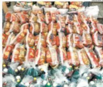
ONG Defensores do Planeta: cestas e kits montados com ajuda de fora